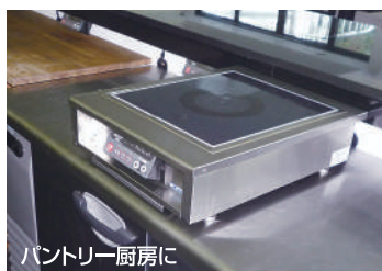
パントリー厨房に