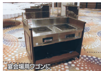
宴会場用ワゴンに

●トッププレートは2種類の中からお選びいただけます。(標準品はHPプレートです)