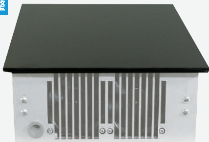
(標準OPプレート:黒ガラス無地)